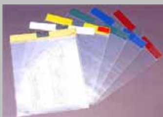
地図収納シリーズ