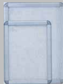
ポスターグリップ